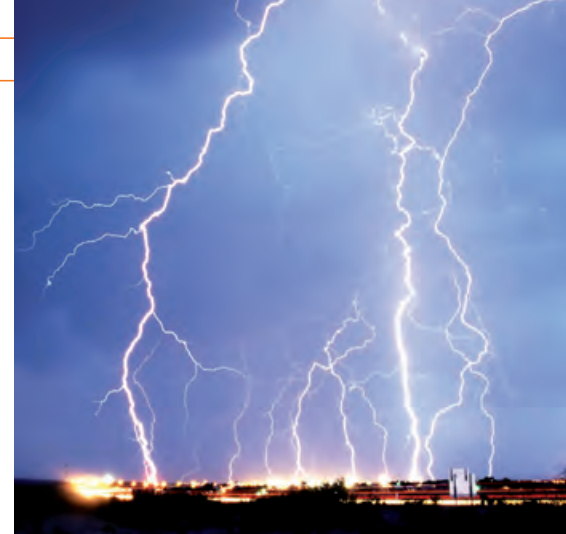
Blitzeinschlag in der Großstadt