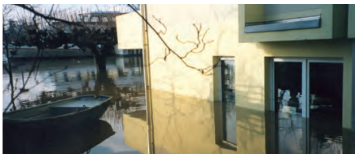
Hochwasser in Königswinter am Rhein