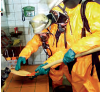
Feuerwehrleute während einer Simulation eines Laborunfalls im Landeskriminalamt Mainz, Rheinland-Pfalz, 2003