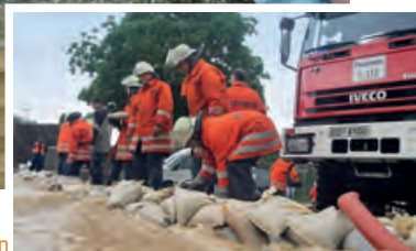
Schutzwälle aus Sandsäcken