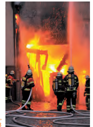
Hausbrand in Monschau, Nordrhein-Westfalen 2008