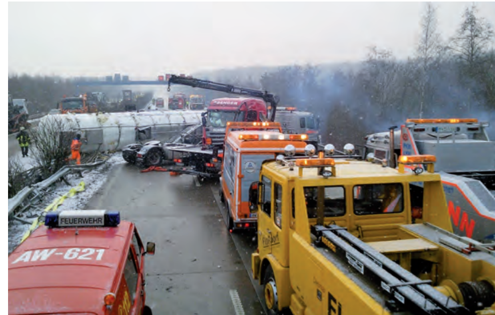
Schwerer Unfall eines Gefahrgut-LKW