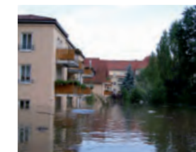
Hochwasser in der Stadt