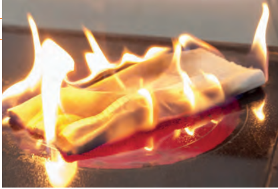
Eine der häufigsten Ursachen für Feuer in der Küche: Ein Handtuch, das auf einer eingeschalteten Herdplatte liegt