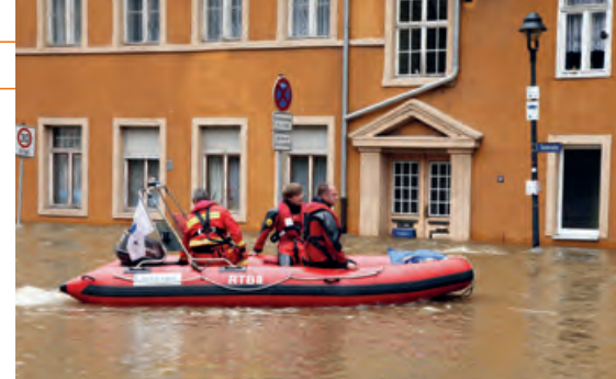
Rettungshelfer beim Hochwasser in Halle, Sachsen-Anhalt, 2013