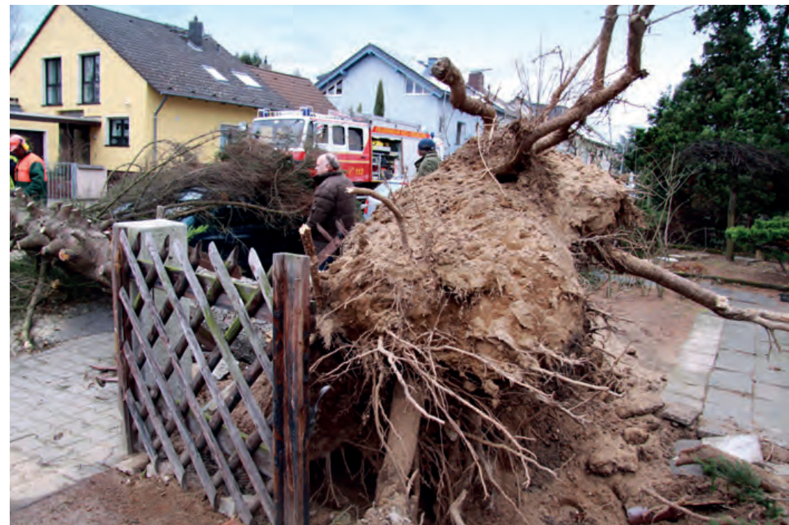
Sturmtief Xynthia sorgte in Hessen für gefährliche Orkanböen, 2010