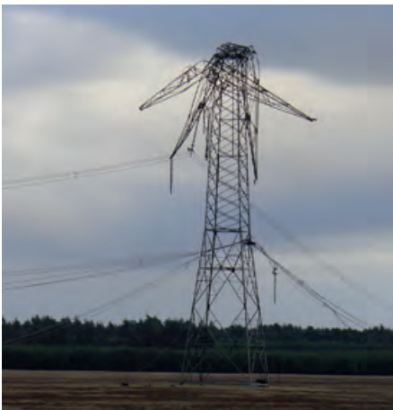
Sturmschaden durch den Orkan Kyrill im Jahr 2007